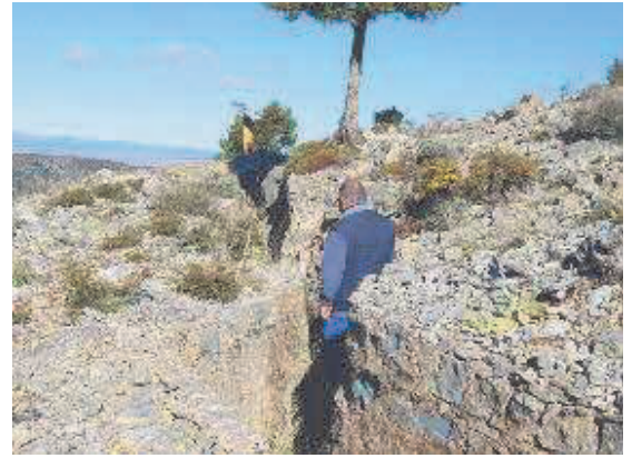
La trinchera en zigzag tiene varias decenas de metros y se puede recorrer. M.C.A.

En Corbalán hay otras líneas de trinchera, peor conservadas, en el paraje denominado Pino Redondo, donde uno de los aspectos más sorprendentes es el nombre, puesto que se trata de un bosque de sabinas centenarias, sin ningún pino a la vista.