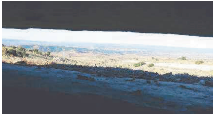
Vistas de Teruel desde el búnker que hay en el Alto de la Torana. M. C. A.

Todavía hay vecinos que recuerdan lo costoso que fue picarla, puesto que parte de esta estructura se asienta sobre roca dura, mientras que otras zonas aparecen reforzadas con mortero de cemento. La trinchera tiene la profundidad suficiente como para servir de protección y también cuenta con una anchura que permitía a los soldados moverse con cierta comodidad.